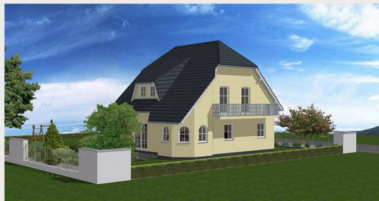
Abbildungen enthalten Sonderausstattungen